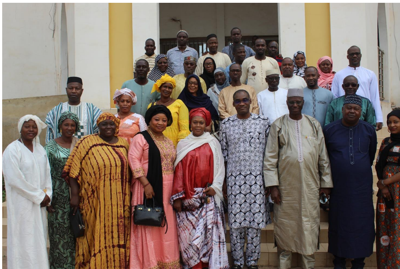
Photo de couverture ©DGESRS : Photo de famille de la cérémonie de présentation de meilleurs vœux 2024