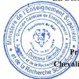
Pr Fana TANGARA Chevalier de l'Ordre National